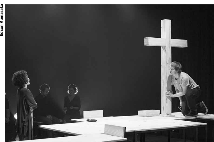
Cena de "Mártir".

Serviço: Teatro Cacilda Becker, R. Tito, 295, Lapa, tel. 3864-4513. Sextas e sábados às 21h e aos domingos às 19h. Entrada franca. Até 04/02.