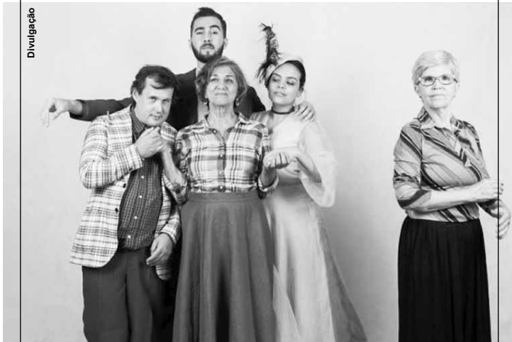
"Entre! A Porta está Aberta".