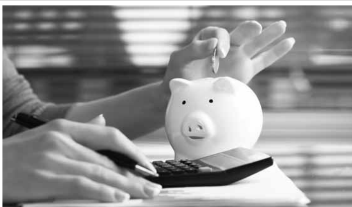
Apenas dois em cada dez (22%) consumidores puderam guardar dinheiro no último mês de outubro.

Nas classes C, D e E, há uma proporção ainda maior de brasileiros que deixaram de poupar em outubro. Oito em cada dez (78%) pessoas que se enquadram nessa faixa de renda não conseguiram poupar ao menos parte de seus salários. Já nas classes A e B, o percentual de não-poupadores diminuiu para 58% da amostra, mas ainda assim revela que o hábito de poupar não é maioria nem mesmo entre a população de mais alta renda.