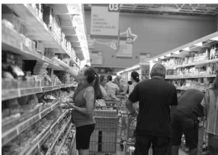
Queda da inflação estimula o consumo e aumenta o poder de compra dos consumidores.

Na última quarta-feira (6), a Selic foi reduzida pela décima vez seguida. Por unanimidade, o Copom diminuiu a Selic em 0,5