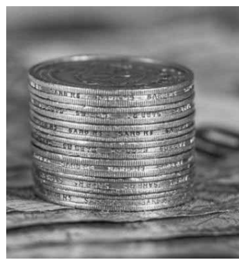
Em 2017 a economia mundial ganhou força com a diminuição das fragilidades associadas à crise financeira global.

Já as razões que podem afetar de forma negativa os