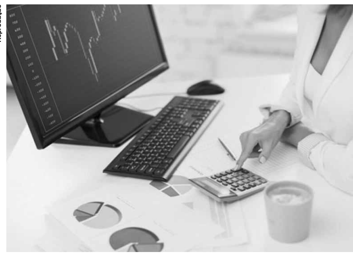
A estimativa por faixa etária revela que é entre os 30 e 39 anos que se observa a maior frequência de negativados.

Em novembro, houve um aumento de 0,23% na quantidade de inadimplentes na comparação com o mesmo mês do ano passado. Na comparação mensal, ou seja, entre outubro e novembro de 2017, o indicador apresentou aumento de 0,15%. "Mesmo com a estabilidade, a cifra ainda é bastante elevada. Para as empresas, o cenário implica a perda de potenciais consumidores; para os consumidores, implica restrição do acesso ao crédito", afirma o presidente do SPC Brasil,