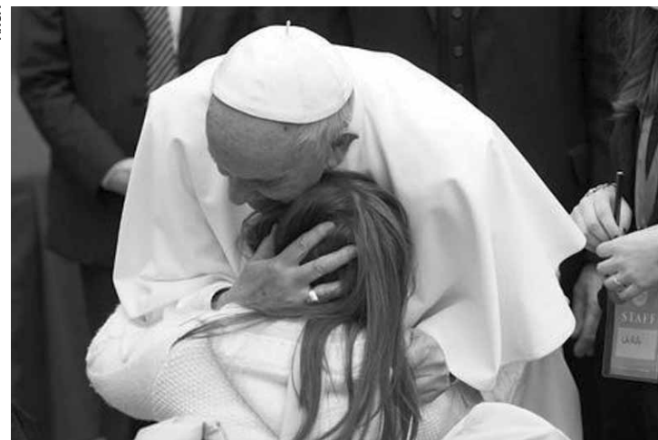
O Pontífice convida à "preservação dos hospitais católicos do risco da mercantilização".

O líder da Igreja Católica ainda afirma que a "inteligência organizacional e a caridade exigem que a pessoa do doente seja respeitada na sua dignidade e mantida sempre no centro do processo de cura". "Essas orientações devem ser próprias também dos cristãos que atuam em estruturas públicas e, que,