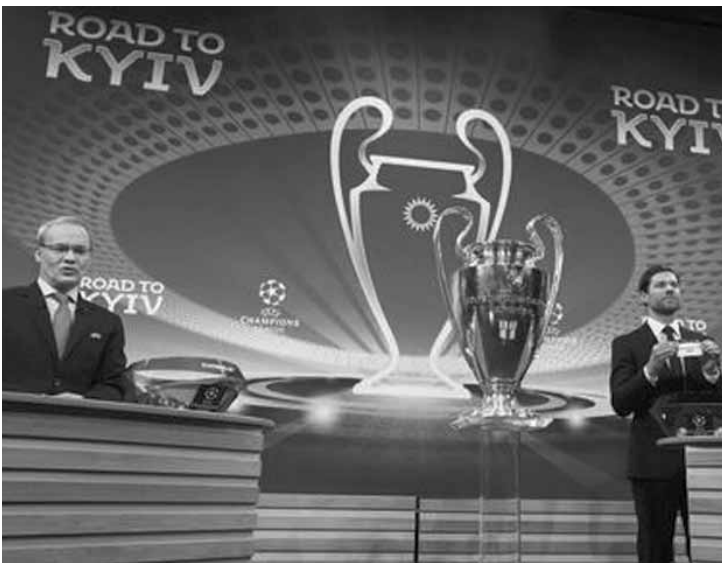
Chelsea enfrentará o Barcelona, enquanto o Real Madrid pega PSG nas oitavas.

A Uefa realizou ontem (11) em Nyon, na Suíça, o sorteio das oitavas de final da Liga dos Campeões. Entre os principais confrontos sorteados, o Real Madrid vai encarar o Paris Saint-Germain (PSG); e o Chelsea enfrentará o Barcelona. Juventus e Roma, únicas equipes italianas na competição, irão enfrentar Tottenham, da Inglaterra, e Shakhtar Donetsk, da Ucrânia, respectivamente.