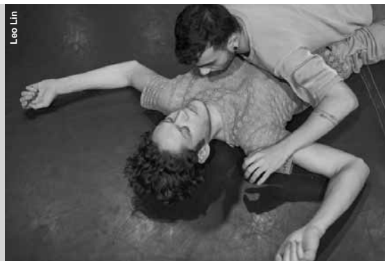
Cena de "Eu Outro", da cia. Fragmento de dança.