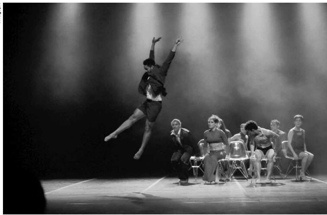
Cena do espetáculo de dança "As Canções que Você Dançou pra Mim".