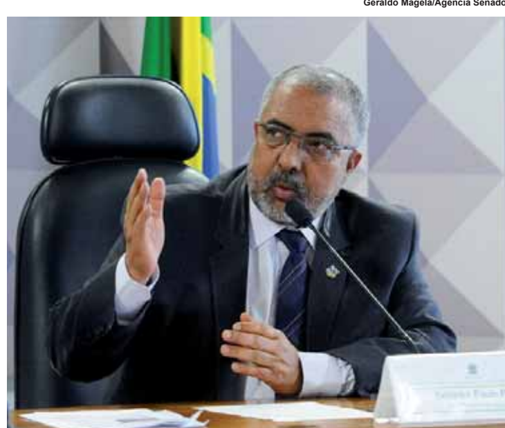
Projeto de Paulo Paim reduz tempo de contribuição para quem tem HIV.