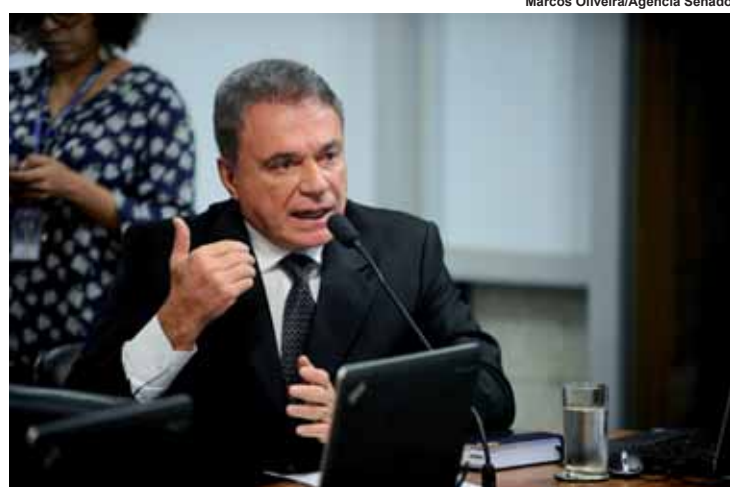
Alvaro quer abater gasto com remédio para aids do Imposto de Renda.