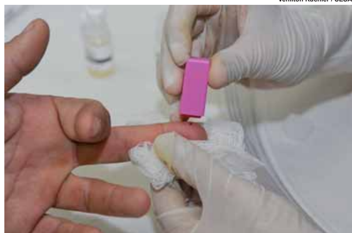
Deteção do HIV é feita por exame de sangue: campanha mobiliza país

— Se a gente não fala do tema, parece que não existe mais o problema do HIV. Mas ele existe — alertou.