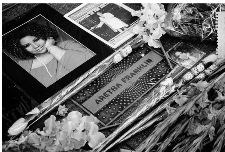
Personalidades publicaram mensagens nas redes sociais.

O ex-presidente Barack Obama, as cantoras Barbra Streisand