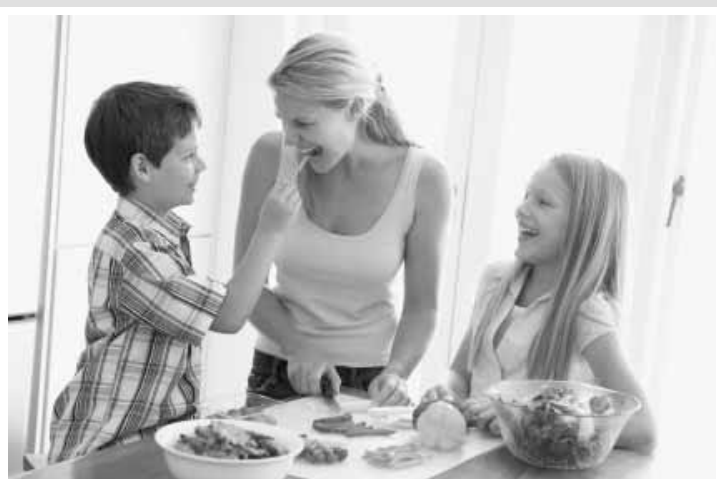
Uma jornada de trabalho flexível possibilita que o colaborador coma de forma mais saudável.

perto de casa, seja na sede da empresa ou em espaços de coworking, contribui, principalmente, com o ganho de tempo na locomoção de casa para o trabalho. “Tempo esse que pode ser aproveitado na academia, no shopping, com amigos ou simplesmente para descansar. O retorno para o empregador é o aumento da produtividade de seus colaboradores, que passam a ter uma vida mais saudável e a desempenhar melhor suas atividades no serviço”, explica.