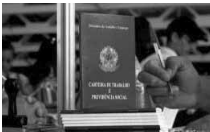
Maioria do aumento das pessoas ocupadas foi na informalidade.

Os dados foram divulgados ontem (30) pelo IBGE. Se comparada a igual período do ano passado, quando a taxa de desemprego era de 11,8%, houve aumento de 0,4 ponto percentual. No trimestre móvel encerrado em outubro o país tinha 33,3 milhões de pessoas empregadas com carteira de trabalho assinada, número que permaneceu